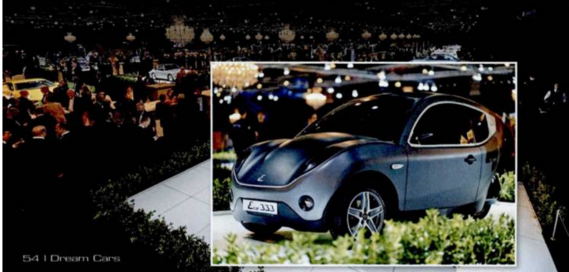
54 | Dream Cars

roues, 100 % électrique, conçue et réalisée en Belgique. Elle se décline en 6 versions de carrosserie et dispose d'une autonomie de 300 kilomètres. Son moteur de 25 Kw lui permet d'atteindre une vitesse maximale de 130 km/h.