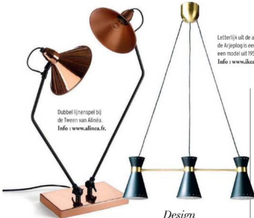
Dubbel lijnenspel bij de Tween van Alinéa. Info : www.alinea.fr .