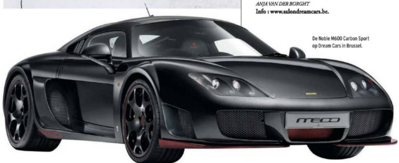
De Noble M600 Carbon Sport op Dream Cars in Brussel.